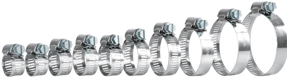
Abrazadera tipo cremallera o Inglesa.